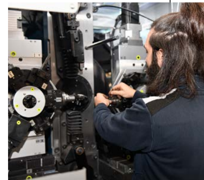
Attrezzaggio ITAYA RX40