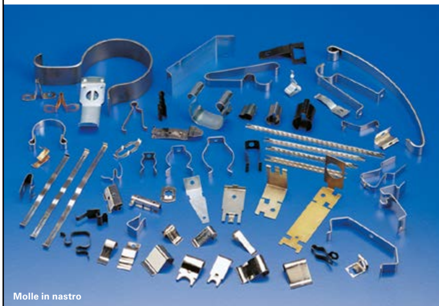
Molle in nastro