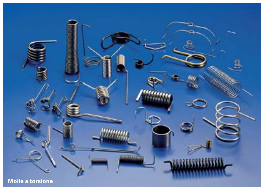
Molle a torsione

NEL BEL MEZZO DI UNA DIFFICILE FASE DI TRANSIZIONE CHE COSTRINGE LE IMPRESE DELLA MECCANICA E NON SOLO A RIPENSARE IL LORO APPROCCIO AL MERCATO E LA LORO ORGANIZZAZIONE INTERNA, METTERE L'ETICA IN CIMA ALLA LISTA DELLE PRIORITÀ È UNA SCELTA CORAGGIOSA MA VINCENTE, NEL PARERE DI UN NOTO MOLLIFICIO OROBICO.